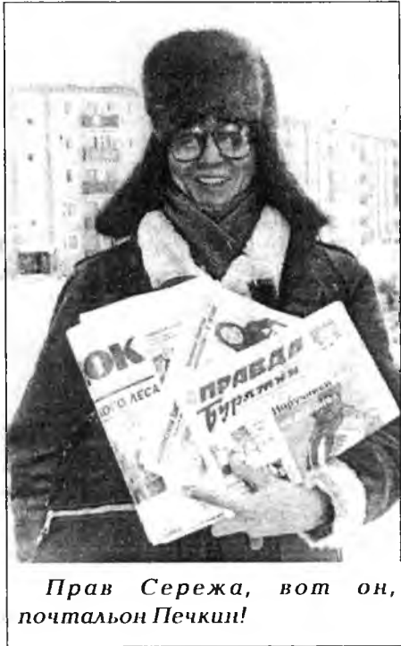
Прав Сережа, вот он, почтальон Печкин!