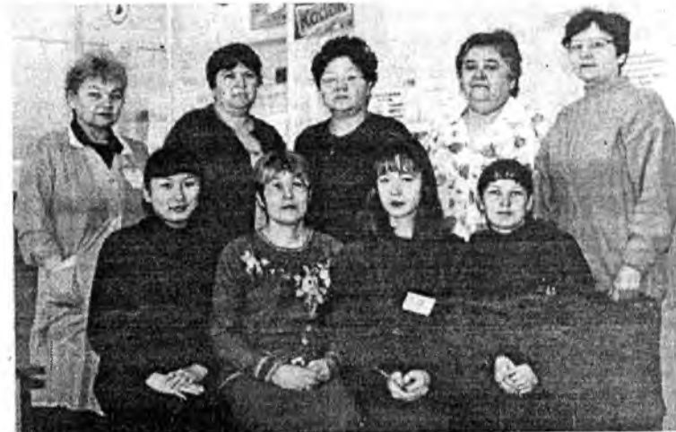
Коллектив 13-го отделения связи