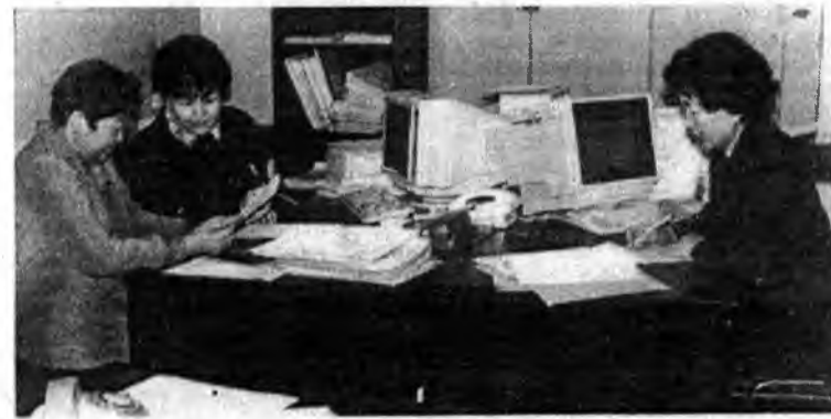
В финансово-экономическом отделе управления