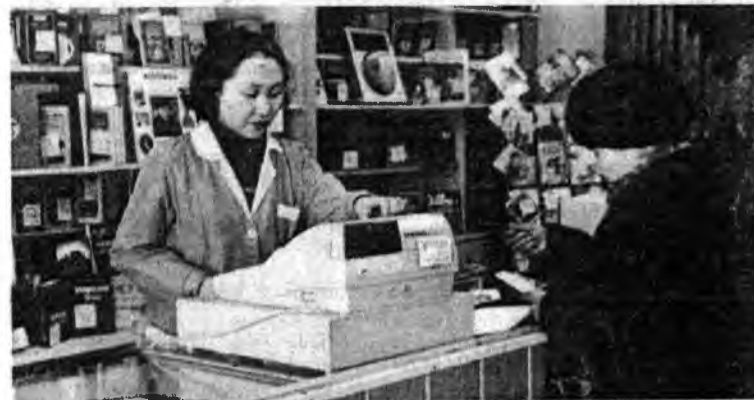
В магазине отделения связи № 13