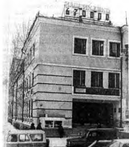
Здание главпочтамта, УФПС, АО «Электросвязь»