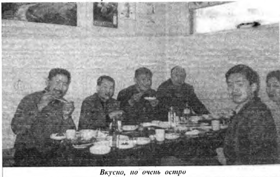
Вкусно, но очень остро

В Корею свято чтут древние традиции и ритуалы. Нам рассказали, что это явилось одной из основных причин быстрого экономического развития страны. Почитание старших, огромное трудолюбие, уважительное отношение к женщине, исполнительность, аккуратность и чистоплотность — все это из арсенала народных традиций, которые удалось использовать в полной мере и с максимальной пользой для достижения корейского экономического чуда.