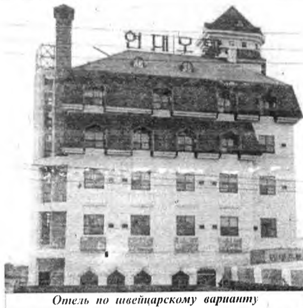
Отель по швейцарскому варианту