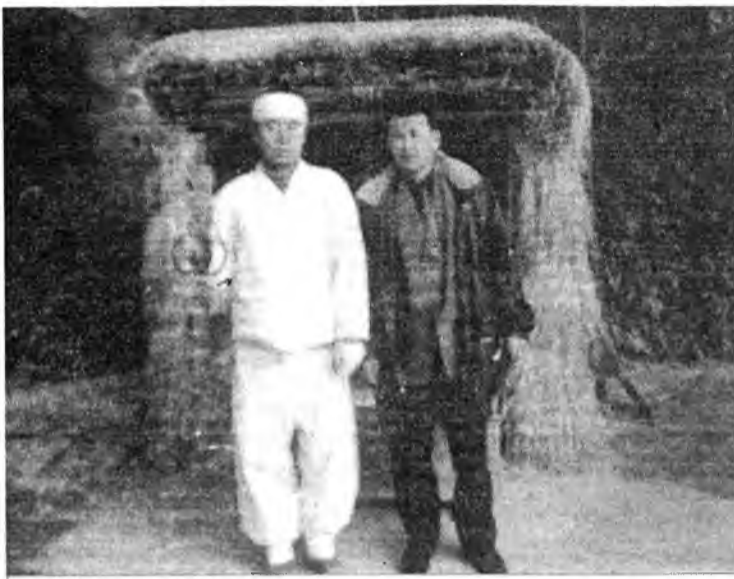
В Этнографическом музее. Национальная одежда крестьян

Начиная с 70-х и почти до конца 90-х годов Республика Корея была одной из самых быстро развивающихся стран в мире — как в экономическом, так и в социальном плане. Благодаря быстрому промышленному и экономическому росту Республика Корея за рекордно короткий срок достигла уровня развитого государства.