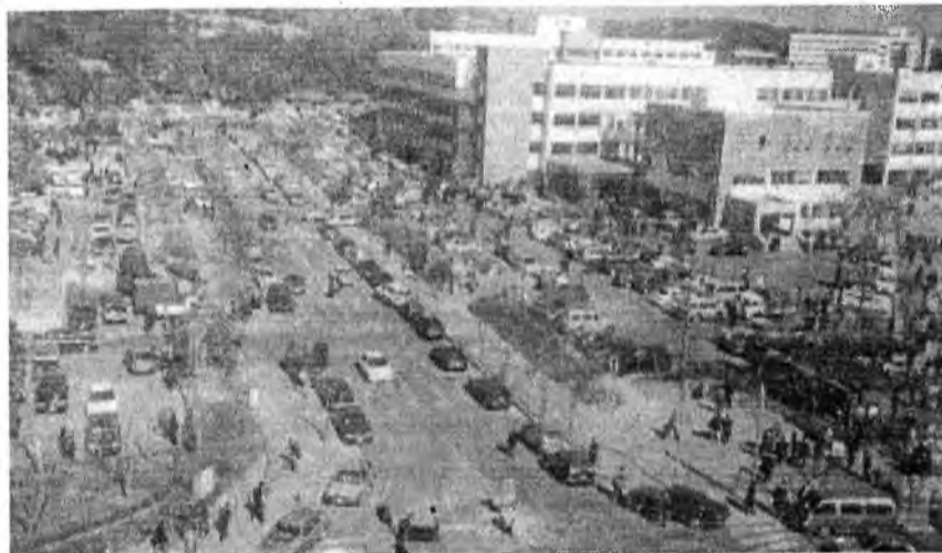
Кенгюльский университет. Освещено не только внутри университета

В терминале аэропорта Кимпо нас встретили традиционным корейским поклоном представители всемирно известной фирмы «Хюндай». Так они встречают любого гостя.