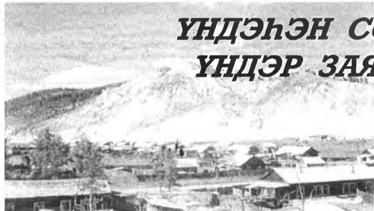
Байгал суута галайн Хойто талые эзэлхэн, Баунт ортон нотагай Тахилтай Сагаан хада Холын айлашадые уринал.