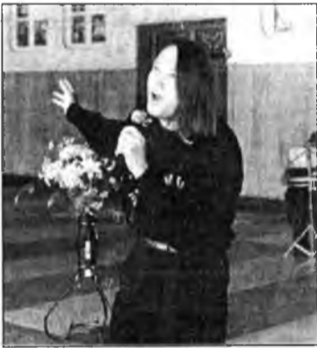
вальсда дуратайшуул сугларха гээд, тэрэ мэдээснэ һэн.

«Прогресс» кинотеатрай администратор Н.Н.Устиновагай хэлэһээр, вальсын үдэшэ һара бүри үнгэрнэ. Апрельин 1-дэ - шог зугаагай үдэр, харин апрелиин 13-да дахинаа залуу