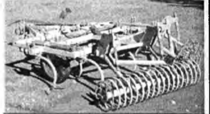
КУЛЬТИВАТОР КПЭ-3,8М с катками выравнивателями КВ-4

Выпускаемый заводом культиватор КПЭ-3,8М разработан на основе серийного культиватора КПЭ-3,8. Модернизация культиватора произведена для возможности (и необходимости) установки катков-выравнивателей КВ-4.