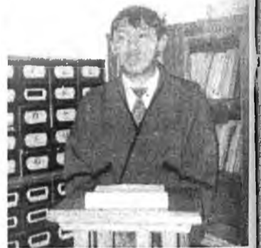
БГУ-ДА БОЛОНОН ОЛИМПИАДАНАА

Буряад хэлэн, ёһо заншалай нэргээгдэжэ эхилхээр тиимэшые үни болоогүй гэхээр. Эдэ бүтэдые хүгжөөлгын ажал ябуулдаг эгээл томо гуламтануудай нэгэн гэхэдэ. Буряадай гүрэнэй университет болоно гэшэ. Мүнөө болотор тус нуралсалай гуламтада факультэдүүдэй хоорондо буряад хэлээр олимпиада болон мурьсөөнүүд болоогүй байһанинь гайхалтай. Одоошые энэ дугуу дунда хүсэлдүүлэгдэбэ.