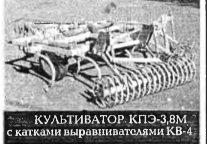
КУЛЬТИВАТОР КПЭ-3,8М с катками выравнивателями КВ-4

Применение культиватора КПЭ-3,8М с КВ-4 позволяет отказаться от дискования и боронования полей. По данным ОПКТБ Сиб ИМЭ (г.Новосибирск) и Западной Сибири от этих операций отказались. Очистка полей от сорняков по данным опытной эксплуатации в Бурятии достигает 95-98%.