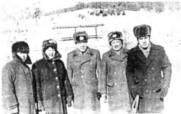
Железнодорожно ОВД-гэй отделиенин хүдэлмэрилэгшэд