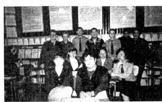
РБ-гэй МВД-гэй хуралсалай түбтэ