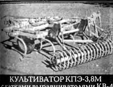
КУЛЬТИВАТОР КПЭ-3,8М с катками выравнивателями КВ-4

20.00 - Премьера НТВ. "ВОСПОМИНАНИЯ О ПОЛУНОЧИ", 1 серия 21.35 - Премьера НТВ. "МЕСТЬ БЕЗ ПРЕДЕЛА" "СТАВКА НА ЧЕРНОЕ" 22.35 - СОВЕРШЕННО СЕКРЕТНО. ИНФОРМАЦИЯ К РАЗМЫШЛЕНИЮ 23.35 - "ИТОГО" с Виктором Шендеровичем 00.40 - ГЕРОЙ ДНЯ 01.00 - "АНТРОПОЛОГИЯ". Программа Д.Диброва 6.12 Радиожурнал «Земля родная» 6.37 Информация, объявления 6.45-7.00 Передача «Багшын бодолнууд» - «Размышления учителя» 7.12 Объявления 7.20 Программа «Анфас» 7.40-8.00 Радиостудия «Бирикан» 12.00 12.10 Дневн. выпуск новостей «Короткой строкой» 19.12 Республ. известия (на бур.яз.) 19.27 Объявления 19.30 Республ. известия (на русс.яз.) 19.45-20.00 Передача из фондов радио