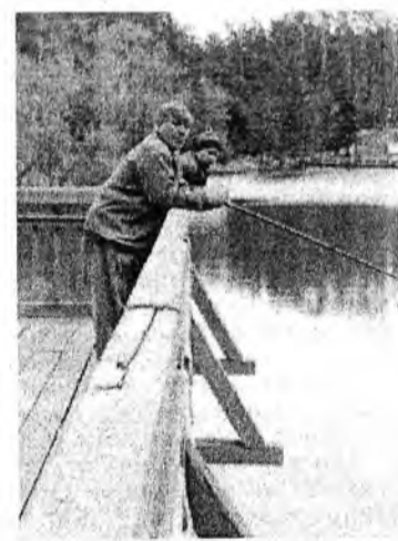
Ловись рыбка, большая, маленькая!