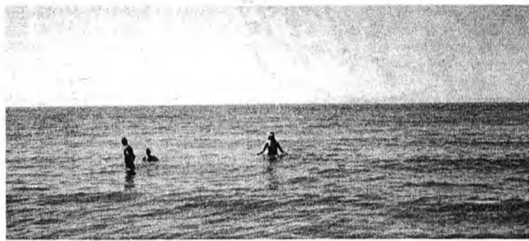
Приятно купаться в Байкале!