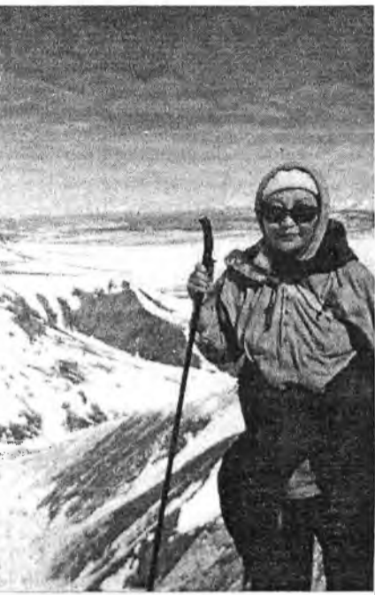
На просторах Окинского плато

Программа наша была достаточно насыщенной и напряженной. Учебно-практическая часть, преодоление горных перевалов до 1500м. над уровнем моря, ледников, восхождение на Мунко-Сардык (3491м) и конечная цель - уборка мусора в зонах отдыха. Звучит очень странно: уборка. Но это действительно так. Неорганизованный туризм и турист представляют большую опасность для природы. Они стараются за короткое время взять от нее как можно больше. Выдрать, вырвать, взобраться на вершину, распить шампанское, съесть банку консервов. Оставить после себя штабеля бутылок, и