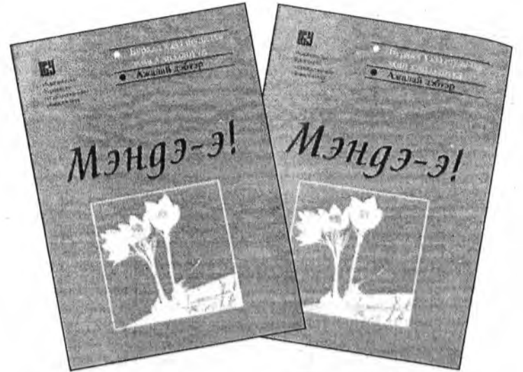
Энэ номдо зориулагдана хуудангамтай эрдэмтэдэй рецензинүүд, мүн тус номоор буряад хэлэ шудалхан оюутанай шүлэг үгтэнэ. «Мэндэ-э!» гэжэ номтой танилсалга июнийн 9-дэ БГУ-га болохонь. Номоор һонирхоһон зонше эндэ уришабди.