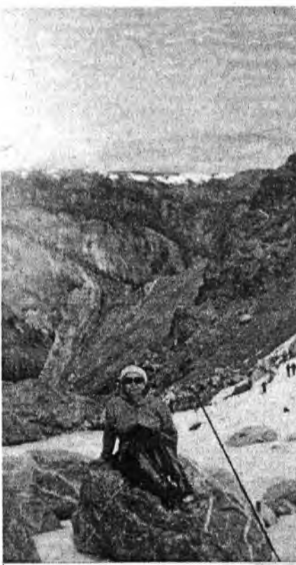
В минуты отдыха

Мунко-Сардык - это священная гора, которой поклоняются не одно столетие. Об этой вершине написано в древних тибетских, монгольских, китайских трактатах. Это святыня, даже мысль о которой должна вызывать благоговение и почтение. Это наше богатство, уникальное наследие. От нашего отно-