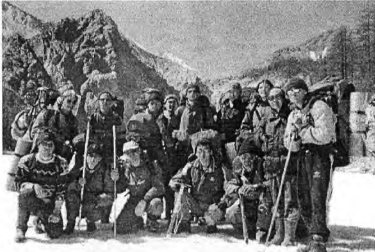
До следующей встречи, величественный Муико-Сарьдык!