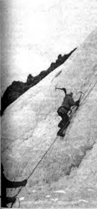
Покорение ледовой стены

горы мусора. Это «кайф» современного туриста, следы которого мы видели повсеместно. Из близлежащих регионов особенно отличаются наши соседи - «любители» природы из Иркутска. Куда смотрит администрация Окинского и Тункинских районов? Неорганизованного туриста всегда можно организовать. Для этого есть возможности и, главное, люди, которые желают заняться этим делом.