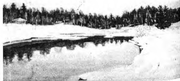
Горячий источник зимой в прошлом веке