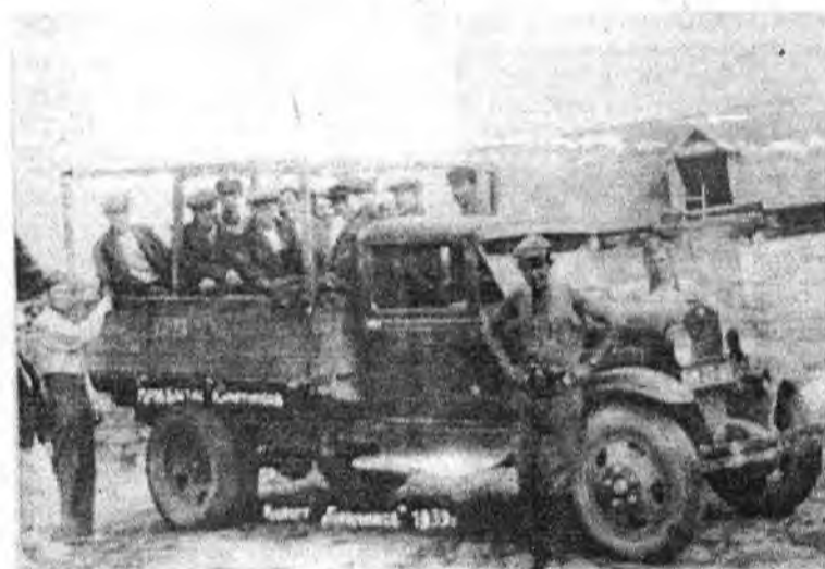
1939 год. Прибыли на отдых