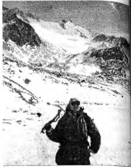
У подножия Муико-Сарьдык

Хүбшын могоно донгодогшо хүхэ борохон хүхышые, Хүдөө хээрэн булжамуур, маряан соохор бүбөөлжэншые, Хүноор хамта байрладаг мээхэй алтан хараасгайшые Хүхэ тэнгэртэ гайдгала магтан дуулана бэшэ аал даа. Уян сагаан сэдхэлтэй унаг буряад басагадшые, Ухамай һаруул бодолтой уран дууша хубүүдшые Уугам ехэ оронойнгоо алиш хизаарта ябахагаа, Уиһан түрэхэн гайдгала дурсангүйгоор яахаб даа! Сарьдаг үндэр ууланууг шуурга халхяар бөөлөжэ, Саһан сагаан малгайгаа орой гээрээ хурьлаал. Дүрбэн зүгэй үүлэг Саяан гээрэм боогнэржэ, Дүхэриглэхэн юртэмсын найман хизаар харгылаал. Дондок УЛЗЫТУЕВ.