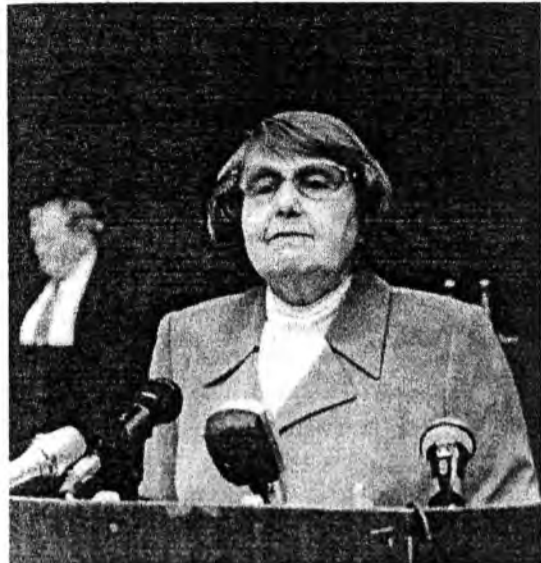
«Сообща выстоять легче»

СОВМЕСТНЫЙ ВЫПУСК КОМИТЕТА ПО ПОДДЕРЖКЕ И РАЗВИТИЮ МАЛОГО ПРЕДПРИНИМАТЕЛЬСТВА МИНИСТЕРСТВА ПРОМЫШЛЕННОСТИ, ЭНЕРГЕТИКИ И ТРАНСПОРТА РБ, РЕСПУБЛИКАНСКОГО БИЗНЕС ЦЕНТРА "ГАРАНТ С", РЕДАКЦИИ ГАЗЕТЫ "БУРЯД УНЭН"