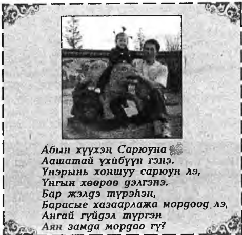
Абын хүүхэн Сарюна Аашатай үхибүүн гэнэ. Үнэрын хоншуу сарюун лэ, Үнгын хөөрөө дэлгэнэ. Бар жэлдэ түрэнэн, Барасые хазаарлажа моргоог лэ, Ангай гүйдэл түргэн Аян замга моргоо гү?

Жэл бүри заншалаа болохон Улаан-Үдэ хотыннай хайндэр Сурхарбаанай урга үдэрын болодог болонхой. Бүхи хайндэрнүүд Советүүдэй талмайһаа эхилхэ. 29-дэ Октябрска үйлсын хайндэр Славин (Алгар сольн) талмай дээрэ болохо, харин июниин 30-да Пушкинай бульвар дээрэ «Наг городом книжная рагуга» гэнэн нэрэтэй уулзалга (үдэрын 19 сарта) үнгэргэгдэхэ. Эндэ Пушкинай хүшөөгэй дэргэдэ поэдүүд, уран зохёолшо, артистнууд хабаадажа, уран бэлгээ дэлгэхэ. Поэдүүд Т.Григорьева, А.Хомяков, А.Гатапов болон бусад нүхэд шүлэгүүдэ уншаха юм. Уншагдадай, сугларагдадай дунда викторина, конкурс эмхидхэгдэхэ. «Буряад үнэн» газетимнай хэблэн гаргадаг «Одон», «Бершины» журналнуудтай, шэнэ номуудтай танилсалгын үдэшэ үнгэргэгдэхэ.