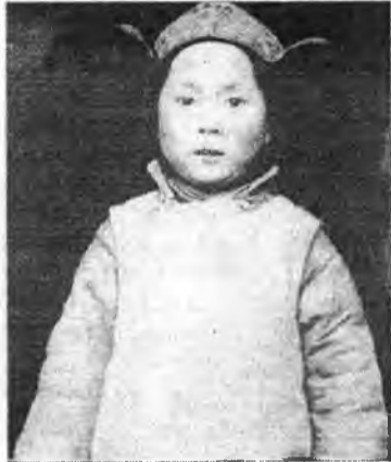
Его Святейшеству 4 года.

Амитан бүхэнэй оройн шэмэг бологсон, Ирагуу сайхан номуун хагаан алдартай, Судар тарниин шажан бүхэний баригша Гэтэлгэгшэ Богдо Золхобадаа мургэмэй. Арьяа Баала, Ом ма ни баг мэ хум! Хуби түгэс Түшигдэхиин оронго Номуун баясхаланта шарялангын эмүнэ, Сэсэг ээсэ мэндэлэжэ мандагсан Итигэл Майгариин гэгээн танаа мургэмэй. Арьяа Баала, Ом ма ни баг мэ хум! Шагжаа хишгээд түгэс мянган мотортой, Абида бээр тэрэгүүн иезн шэмэгсэн. Амитан бүхэний энэрэхы сэдьхэлтэй Арбан нэгэн нигууртадаа мургэмэй. Арьяа Баала, Ом ма ни баг мэ хум! Эмүнэ зүгүүн Бугалангуун оронго, Эрдэнтэ сагаан номуун агын доторто Элдэб зүйлүүн бошог иээр сагуугсан Хорин нэгэн Дара эхдээ мургэмэй. Арьяа Баала, Ом ма ни баг мэ хум!