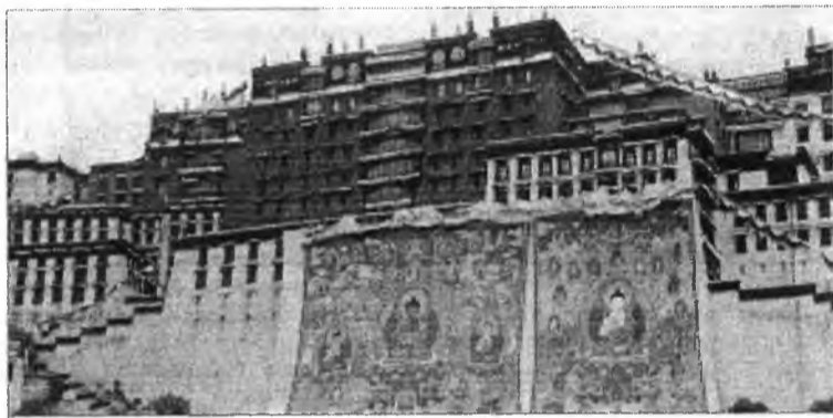
Потала - резиденция Далай-Лам. Лхаса.