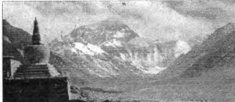
Священный Ганченджанг. Тибет.