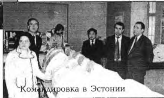
Командировка в Эстонии