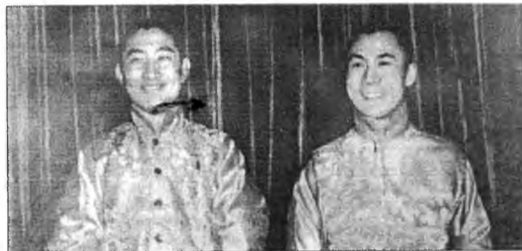
Панчен Лама X и Далай-Лама XIV.