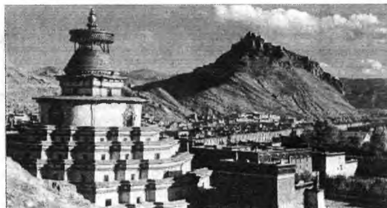
Храм. Сто тысяч Будд. Тибет.