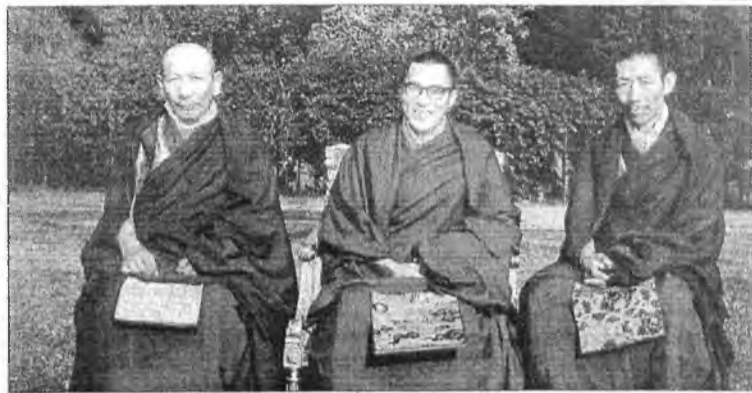
Его Святейшество с учителями Линг Ринпоче и Тричжанг Ринпоче.

Уважаемые читатели! Примите вас отнестись к фотографиям Далай-Ламы с должным почтением, хранить в местах, не подлежащих загрязнению и осквернению.