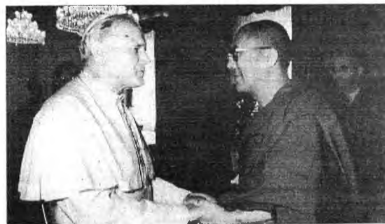
Встреча с Папой Римским.