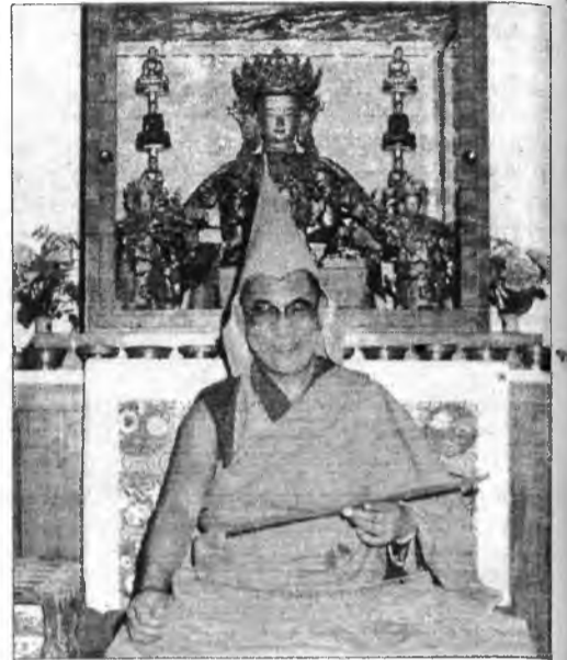
Его Святейшество Далай-Лама XIV Тензин Гьяцо

Амитан бүхэнэй оройн шэмэг бологсон, Ирагуу сайхан номуун хагаан алдартай, Судар тарниин шажан бүхэний баригша Гэтэлгэгшэ Богдо Золхобадаа мургэмэй. Арьяа Баала, Ом ма ни баг мэ хум! Хуби түгэс Түшигдэхиин оронго Номуун баясхаланта шарялангын эмүнэ, Сэсэг ээсэ мэндэлэжэ мандагсан Итигэл Майгариин гэгээн танаа мургэмэй. Арьяа Баала, Ом ма ни баг мэ хум! Шагжаа хишгээд түгэс мянган мотортой, Абида бээр тэрэгүүн иезн шэмэгсэн. Амитан бүхэний энэрэхы сэдьхэлтэй Арбан нэгэн нигууртадаа мургэмэй. Арьяа Баала, Ом ма ни баг мэ хум! Эмүнэ зүгүүн Бугалангуун оронго, Эрдэнтэ сагаан номуун агын доторто Элдэб зүйлүүн бошог иээр сагуугсан Хорин нэгэн Дара эхдээ мургэмэй. Арьяа Баала, Ом ма ни баг мэ хум!