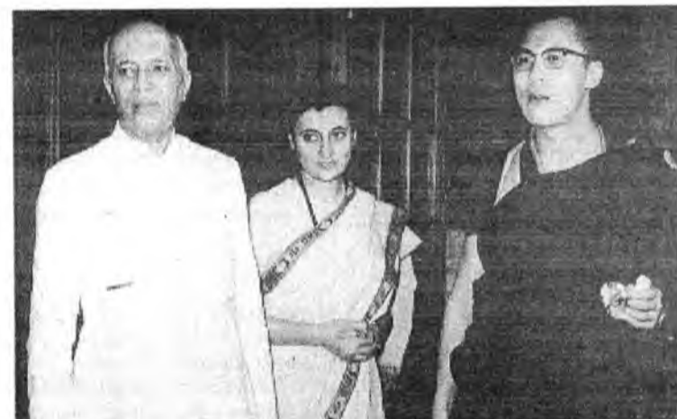
Премьер-министр Индии Джавахарлал Неру с дочерью Индирой Ганди и Его Святейшество.