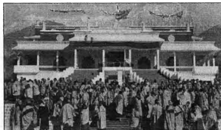
«Гоман Дацан». Южная Индия.

Да пребывают во веки лотосные стопы Далай-Ламы - воплощения Авалокитешвары, Источника всех благ и счастья, В этой стране, окруженной снежными горами! Силой исполненных восхвалений и молитвы к Вам В любой стороне, где бы не находились.