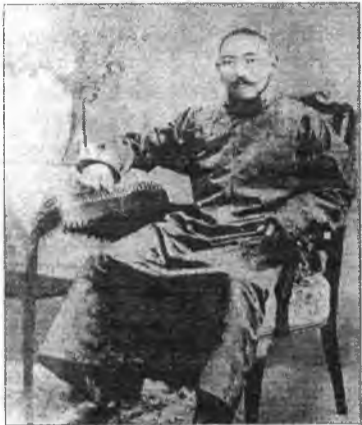
ХIII Далай-Лама Тубтен Гьяцо.

Шестого июля сего года Его Святейшеству Далай-Ламе