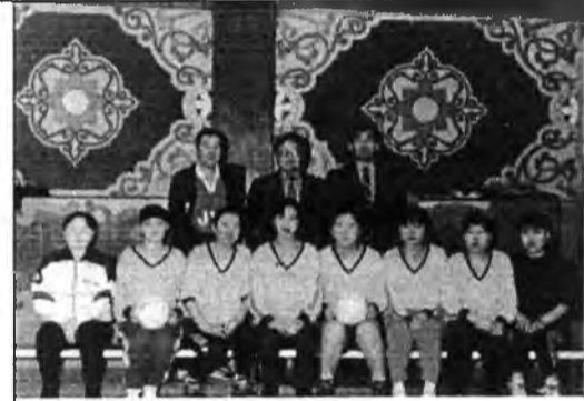
Со спортивной командой лицея

Будучи в лицее, поинтересовалась мнением коллег,