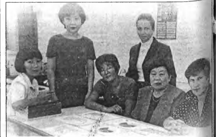
Сотрудники отдела статистики, информации и исследования

В преддверии юбилея желаю налоговикам успехов в их трудном деле, и, конечно же, здоровья и оптимизма!