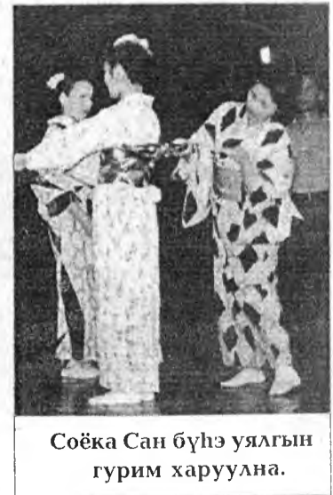
Соёка Сан бүһэ уялгын гурим харуулна.