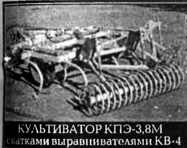
КУЛЬТИВАТОР КПЭ-3,8М скатками выравнивателями КВ-4

Вертинский и Михаил Жаров в фильме Исидора Анненского «Анна на шее» 15.00 «Сегодня» 15.30 Криминал. «Чистосердечное признание» 16.00 Мир приключений. «Голубое дерево» (Аргентина-Италия) 17.00 «Сегодня» 17.25 «Намедни-67» 18.15 «Карданный вал» 18.25 «Впрок» 18.40 «Криминал» 19.00 Т/с «Она написала убийство» (США) 19.55 Час сериала. Чак Норрис в боевике «Крутой Уокер: правосудие по-техасски». 21.00 «Сегодня» 21.35 Мир кино. Стюарт Уитмен в остросюжетном фильме «Сокровища Амазонки» (США-Мексика) 23.20 Документальный сериал. «XX век. Русские тайны. 1911 г. Выстрел в театре» (Россия-США) 00.00 «Сегодня» 00.40 «Антропология». Программа Д. Диброва РАДИО 6.12 Радиожурнал «Земля родная» 6.37 Информация, объявления 6.45-7.00 Передача «Будни энергетиков Бурятии» 7.12 Объявления 7.20 Программа «АНФАС» 7.40-8.00 Радиостудия «Биракан» 12.00-12.10 Дневной выпуск новостей «Короткой строкой» 19.12 Республиканские известия (на бур. языке) 19.27 Объявления 19.30 Республиканские известия (на русс. языке) 19.45-20.00 «У микрофона - учитель». Беседа с главным специалистом отдела профессионального образования Министерства образования и науки республики Б.Д. Тушиновой