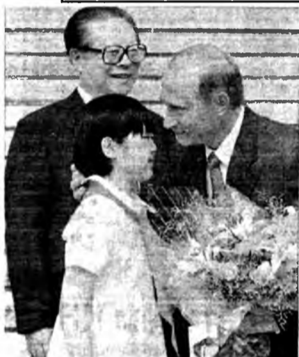
Пионеры в Пекине и Пхеньяне очень полюбили российского президента. Неплохие отношения сложились у него и с Цзян Цзэминем.

павильоном «Тайхэ» - «Небесной гармонии». Любители кино наверняка запомнили снятую здесь сцену