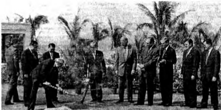
Старинный завет: «Возделывай свой сад».

В огромный музейно-архитектурный комплекс кортеж въехал через главные ворота перед величественным