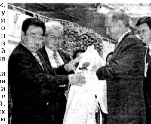
Дзюдоист Путин несколько смущился, когда ему присвоили «черный пояс» и девятый дан каратэ. Но все равно приятно.

павильоном «Тайхэ» - «Небесной гармонии». Любители кино наверняка запомнили снятую здесь сцену