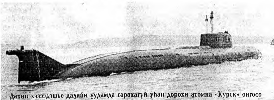
Дахин хэзээдэше далайн уудамда гарахагүй ухан дорохи атомна «Курск» онгосо