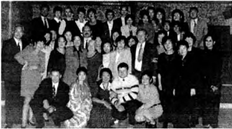
Коллектив РКВД. 1999 г.