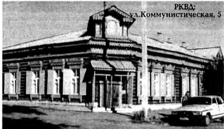
РКВД: ул. Коммунистическая, 5

Так как уровень заболеваемости сифилисом в республике был очень высоким, к 1931 году было развернуто 9 венпунктов. В эти годы была проведена большая научно-практическая работа, результатом которой явилось резкое снижение заболеваемости сифилисом.