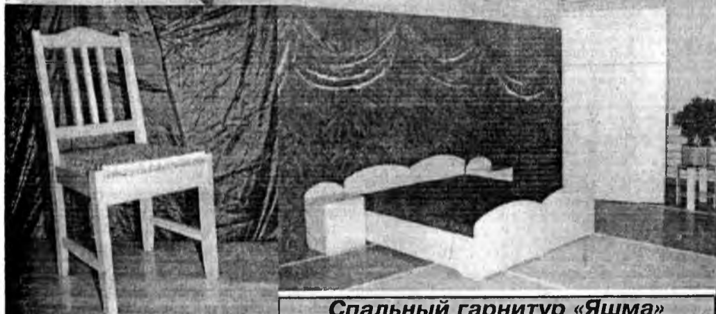
Спальный гарнитур «Яшма»