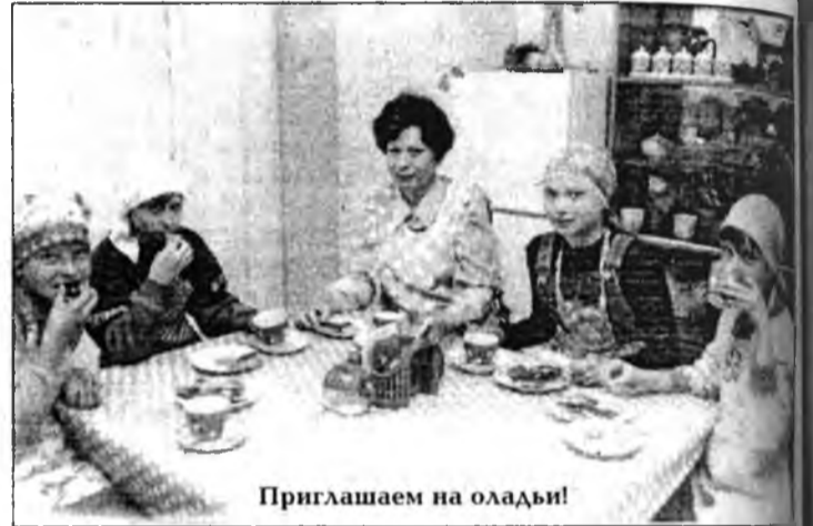
Приглашаем на оладьи!