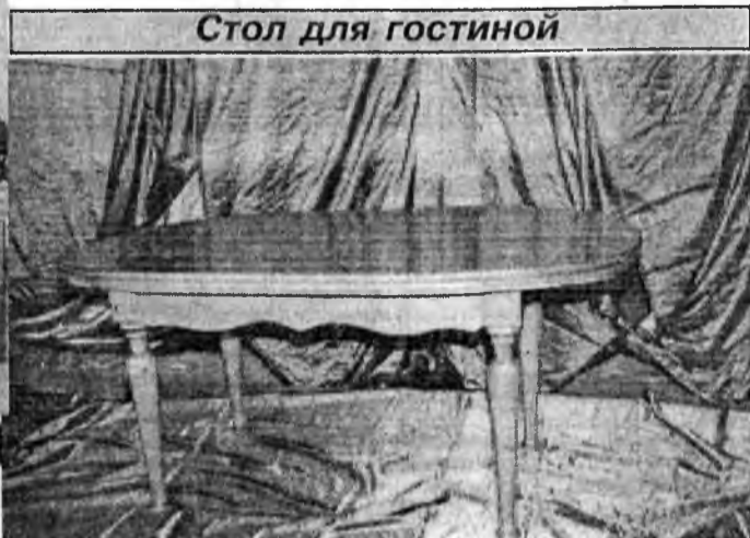
Стол для гостиной