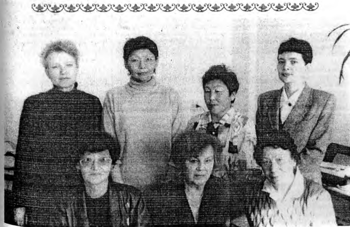
Коллектив: ветераны и молодое поколение медиков