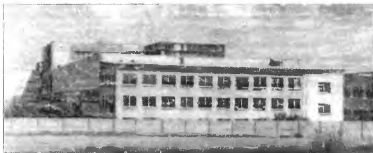
ОАО «Тимлюйский АЦИ»