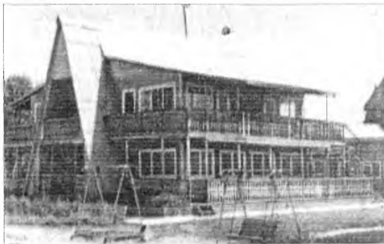
А это продукция завода