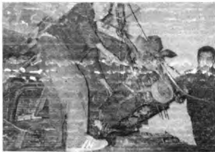
Идет ремонт машин