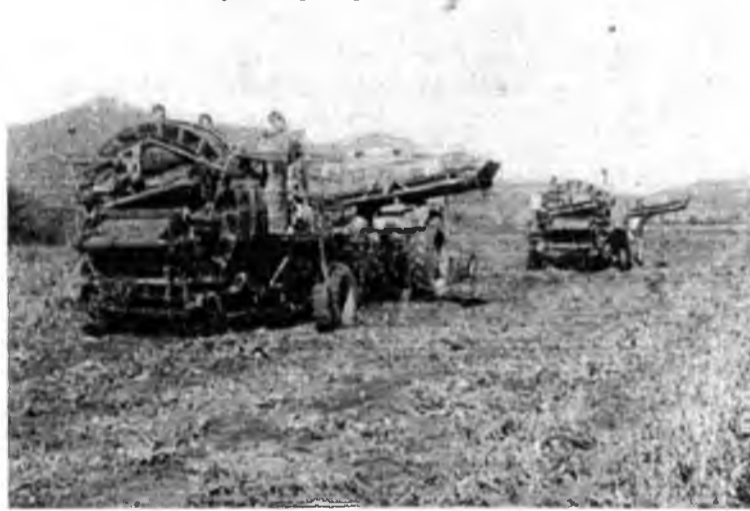
Уборка картофеля в Старой Бряни