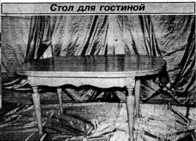
Стол для гостиной

г. Улан-Удэ, ул. Ключевская, 21, тел.: (3012) 33-29-15