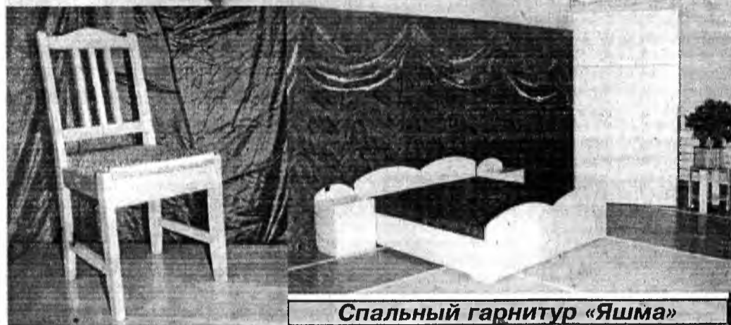
Спальный гарнитур «Яшма»