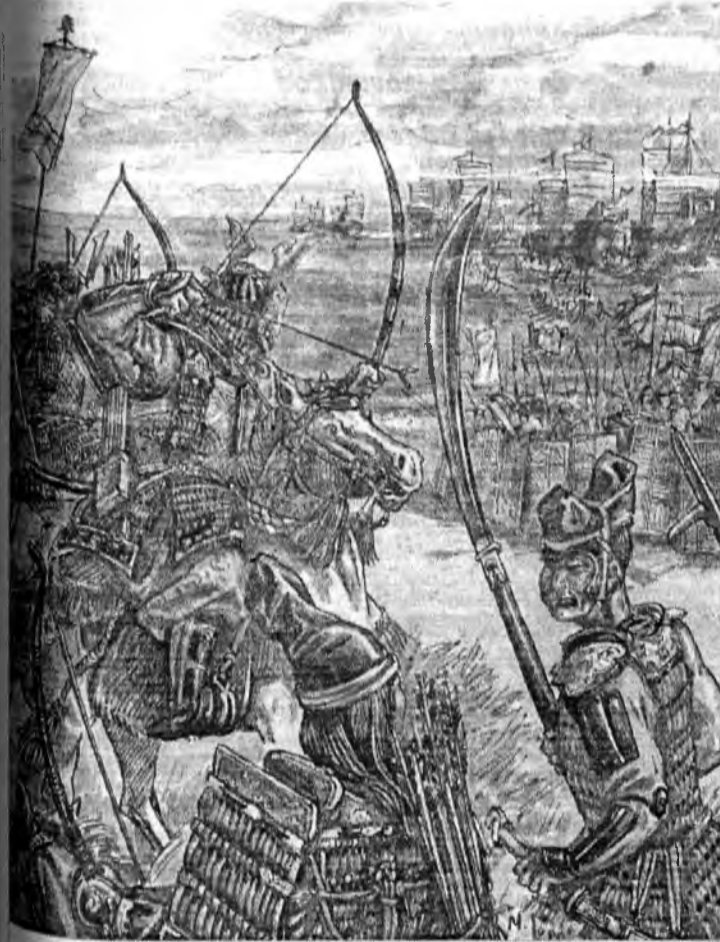
Японские самураи пытаются помешать высадке войск монгольского императора Хубилай-хана

Рассматривая градостроительную культуру Золотой Орды в целом, можно отметить, что на огромной территории государства достаточно четко выделяются зоны конкретного влияния самых различных традиций. Верхнее и Среднее