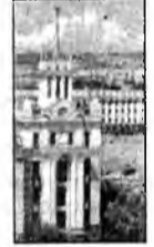
Бурятская государственная телерадиокомпания