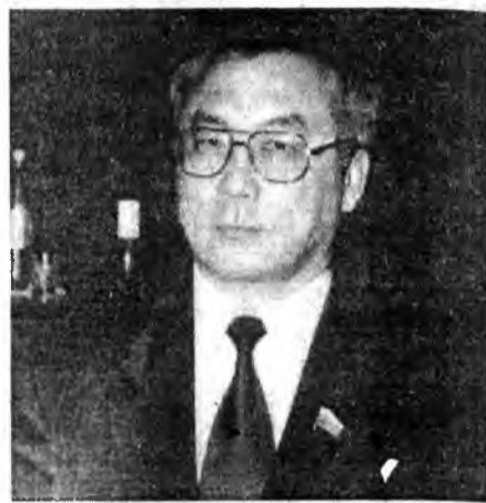
Наш корреспондент беседует с главой администрации Агинского Бурятского национального округа

«Я НЕ ПРЕДСТАВЛЯЮ ЧИТИНСКОЙ ОБЛАСТИ БЕЗ АГИНСКОГО ОКРУГА»