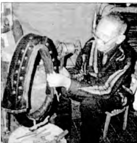
музей эмхидхэхэ байгаабди гэнэ. - Хайрата уран гартай эсэгэмнай 75 наһатай болобо гэшээ. Олон үрингэринь булта суглархадаа, 30 хүн болодогбди гэнэ.