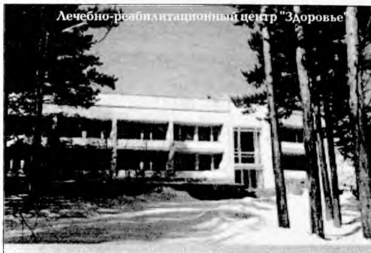
Лечебно-реабилитационный центр "Здоровье"

В ЛРЦ «Здоровье» есть санаторно-оздоровительный лагерь круглосуточного действия. Путевки распределяются через фонд социального страхования. Работник предприятия через агента по социальному страхованию по заявке может получить путевки на 21 день по цене 5-10% от стоимости. Также Лечебно-реабилитационный центр имеет свое терапевтическое отделение. В это отделение после стационарного лечения больные и выздоравливающие попадают по направлению терапевта, врача-невролога. Или же желающие могут сами приобрести путевку. В РК «Здоровье»