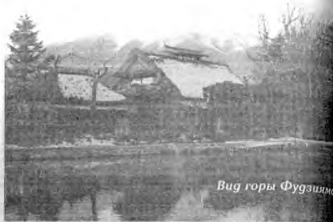
Вид горы Фудзияма.

В этом году в связи с национальным праздником Сагаалган в республике проводится ставший уже традиционным фестиваль японских фильмов. Организует его Информационный отдел посольства Японии в Российской Федерации при содействии Общества дружбы «Бурятия-Япония», Министерства культуры Республики Бурятия и администрации г. Улан-Удэ.