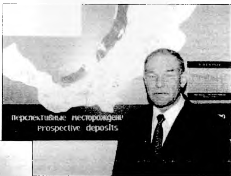
перспективные месторождения prospective deposits

Планомерное изучение нефрита на территории Бурятии начато с 1978 года геологами Восточно-сибирской партии, ныне ГПП «Байкалкварцсамоцветы».