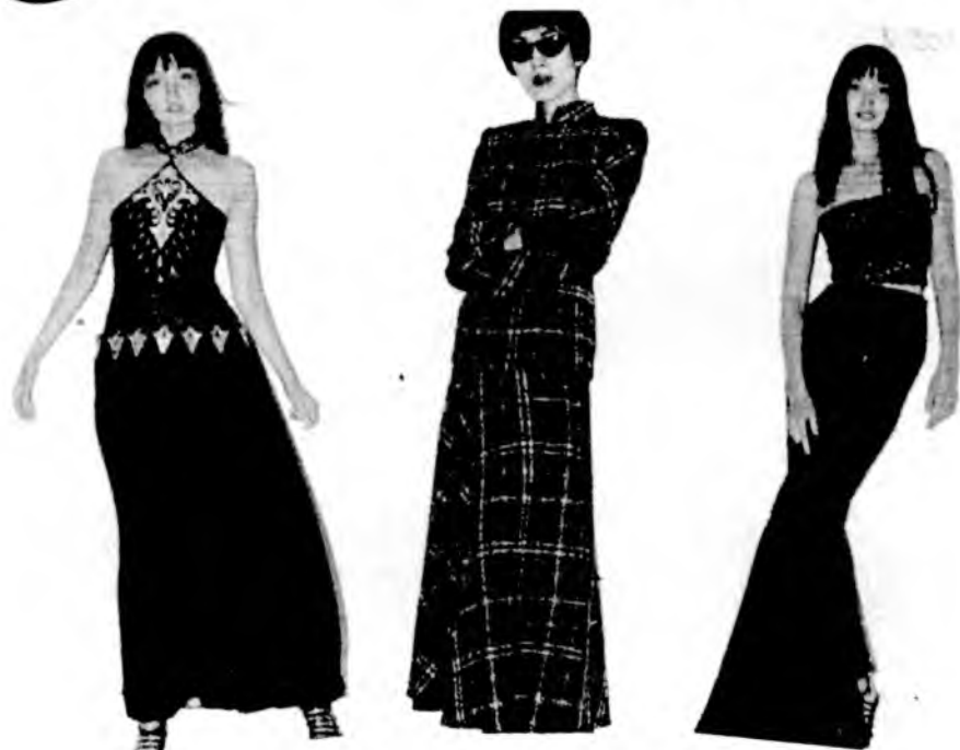
Эскизы и модели Л.А.ДАГДАНОВОЙ