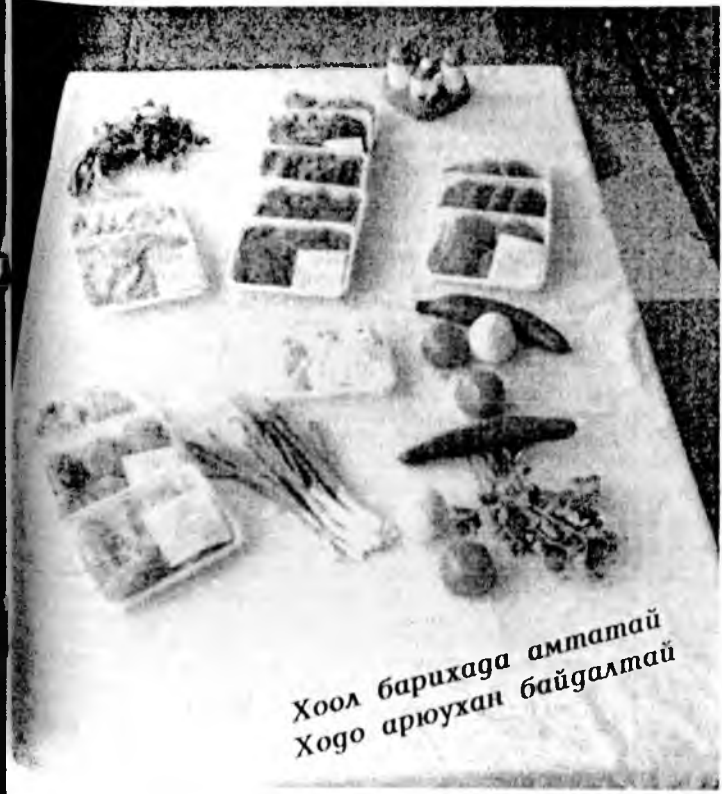
Хоол барихада амтатай Ходо арюухан байдалтай