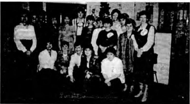
«А ну-ка, девушки» гэхэн конкурсдо хабаадагшад