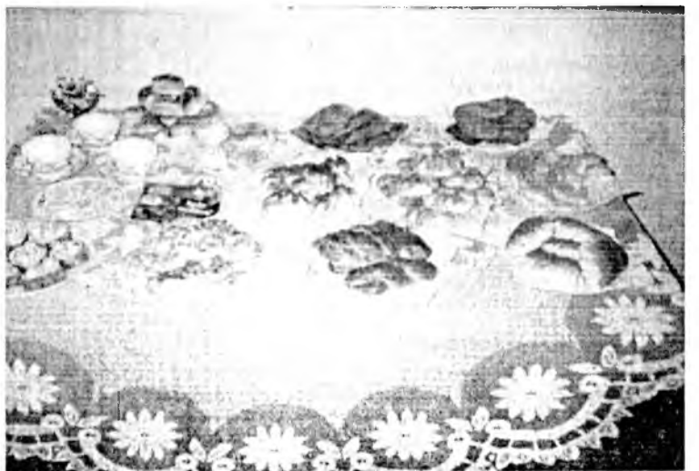
Талхаар хэлэн таатай зохид амтан зүйлүүд