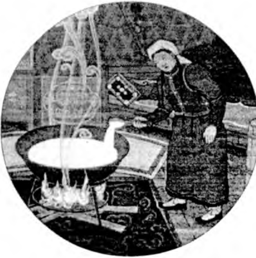
һааһи, би уймар тэнгэ таанары Хурмаста тэнгэригэ хэлэжэ, хара зоболон

хүгшэнэй зүүн нюганһөө нөлбонон, баруун нюганһөөнн шуһан гаржа байбалгаа. Нюгөө аршажа байгаа, энэ хүгшэн ехэ гомдолтойгоор: - Нэгэ эхэнэр нюдмни хутагаар хадхаад, үбдэжэ байнаб, гэжэ хэлэбэ ха. Энэнише дуулаад, энэ наһатай хүн галай бурхан байна гэжэ эхэнэр ойлгожо, хүгдэжэ мүргөөд, олон удаа буруугаа мэдэжэ, аргадаба, гуйба гэхэ. Тийгэхэдэнь, галай бурхан: - Мүргэжэ болц, бодо, шинн үдэр бүри эртэ бодожо, гэрэйнгэ бүхэ ажал хэжэ байгаа хадаһи, үршөөл хайрлааб. Дахин иигээ