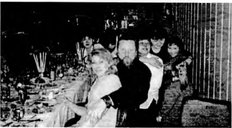
Наага зугаатай найрай үедэ