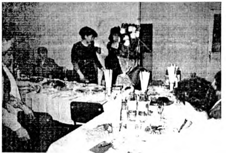
Наада зугаатай найрай үсгэ