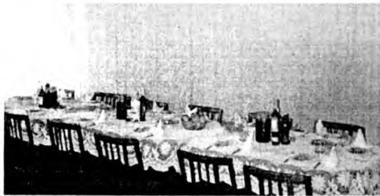
Баян дэлгэр, найхан-стол бултанай оролдолгоһоо