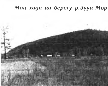
Мон хада на берегу р.Зуун-Морин

Нүхэн-Дабан (Здесь по преданию потомки Кияна и Нукуза, прожив 450 лет, во главе с Борто-Чино вышли из теснины Эргүнэ-Куи (Эрхүү-Нэхүн).