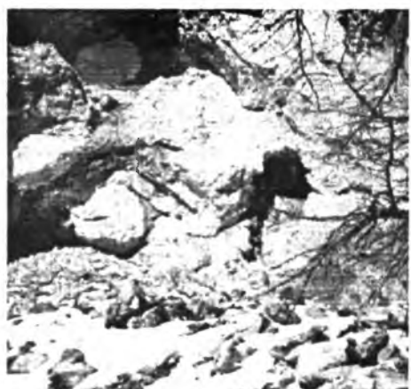
Мон хада на берегу р.Зуун-Морин

В заключение хочу остановиться на одном моменте, на что С. Чагдуров заостряет внимание читателя. В своем заключении он пишет об эпохе Чингисхана следующее: «Если итальянец Марко Поло еще в конце XIII в. выразил свое искреннее и глубокое сожаление по поводу незавершенной до конца миссии императора-мироворца, этого, по его