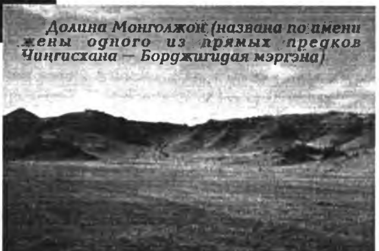
Долина Монголожой (названа по имени жены одного из прямых предков Чингисхана — Борджигудая мэргэна)