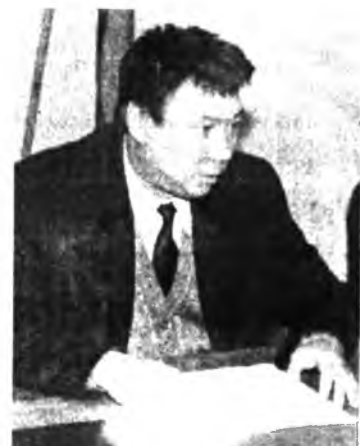
С.Г. ЕФИМОВ, председатель совета фонда государственного внебюджетного Фонда социальной поддержки населения С.Г. ЕФИМОВ.

По проекту закона РБ «О внесении дополнений в Закон Республики Бурятия на 2001 год» выступил министр труда и социального развития, председатель совета фонда государственного внебюджетного Фонда социальной поддержки населения С.Г. ЕФИМОВ. По сути речь шла о предоставлении налоговых льгот путем внесения изменений и дополнений в уже существующий закон. Предлагалось внести в этот законопроект абзац следующего содержания: «От уплаты государственные пенсионные фонды, управляющие компаниями, создаются от уплаты налога в отношении имущества, приобретенного в результате размещения пенсионных резервов государственных пенсионных фондов».