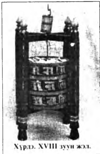
Хүрд. XVIII зуун жэл.

сансары важна идея родственности (эхэ бологсон) и равенства (сасагуу) всего живого (хамаг амитан).