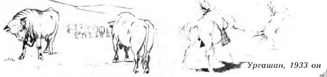
Ургашан, 1933 он