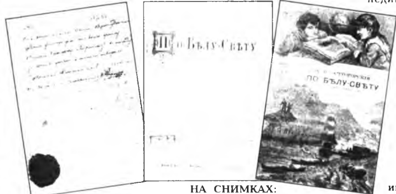
НА СНИМКАХ: форзац; титул; шмуцтитул книги.