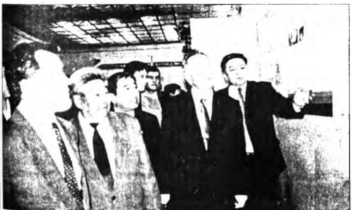
ХУДОЖЕСТВЕННЫЙ музей имени Сампилова всегда радует жителей столицы разнообразными выставками. На сей раз в его стенах - разработки Сибирского отделения Российской Академии наук.

известными и крупными фирмами и компаниями, но и с теми, кого называют в России малым бизнесом. Кстати, последние выпускают современную продукцию, пользующуюся спросом.