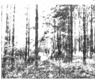
Проезд авт. №8 до ост. "Дом отдыха", тел.34-45-75

09.00 "Прогноз погоды", "Сеньора" 09.30 Хит-парад на ТНТ 09.50 Телемагазин 10.00 "Из жизни женщины" 10.30 Т/с "Люди в штатском" 11.25 "Прогноз погоды" 11.35 Фильм "Возвращение в затерянный мир" 13.30 "Телемаркет" 13.50 "Недвижимость" 14.00 "Телемагазин" 14.30 Т/с "Королева сердец"