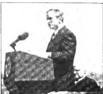
В Университете национальной обороны Буш выступил с ключевой речью о безопасности Америки. Остальное - не в счет.

Американский Президент Джордж Буш сделал миру неприятный первомайский «подарок» - в этот день объявил о принципиальном решении приступить к созданию национальной системы противоракетной обороны. Многие утверждают, что это решение ставит под вопрос существующую систему международной безопасности.