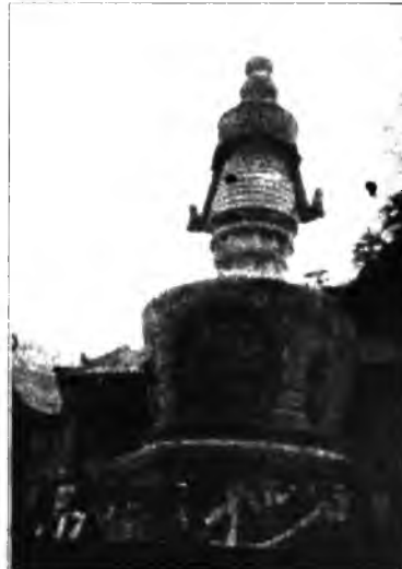
Субурган Джан джа Ролбий Дорже

проникнове буддизма на Утайшане произошло в годы э правления Юн л (вечное спокойствие 58 - 157) династии Хань (Восточная Хань 206 г. до н.э. Строительством первого монастыря связано деятельностью древних индийских Архатов. Вообще на раннем этапе развития буддийского комплекса на Утайшане большую роль играли проповедники из Индии и Непала. И в последующие Утайшане неоднократно посещали монашеские делегации из Индии и Японии. В год династии Суй на пяти