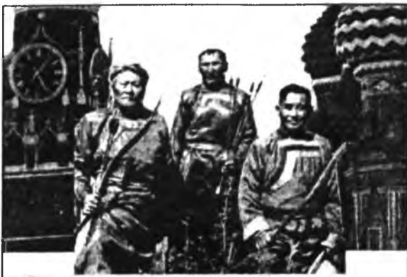
Может быть, Москва увидит еще бурят, прискакавших на коней..