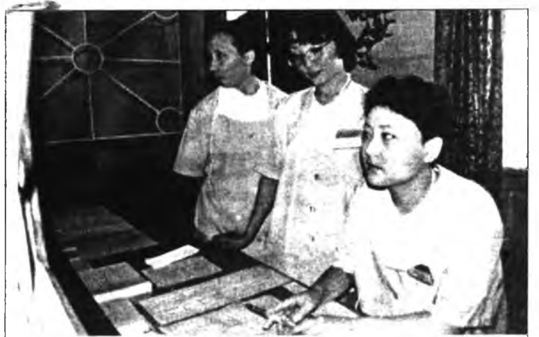
Медперсонал приемно-диагностического отделения

В больнице скорой помощи есть и такое отделение, название которого для непосвященного в азы медицинской терминологии покажется сложным. Отделение гемодиализа или, как его еще называют по-простому, «искусственной почки», в нашей республике единственное. Предназначено оно для оказания специализированной медицинской помощи взрослым и детям, страдающим острой хронической почечной