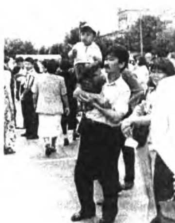
-Какие же у вас планы на будущее?

-Со всеми до 18 лет. И в целом могу отметить, что к проблемам детей в Бурятии серьезно подходят Министерство труда и соцразвития, образования, ФЗН, Мэрия. Хотел бы отметить по делам молодежи, туризму, физкультуре и спорту РБ, Министерство здравоохранения. Детский фонд также активно сотрудничает с такими общественными организациями как «Байкальские надежды», «Союз многодетных семей» и т.д.