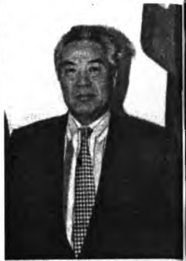
Генеральна консул Н.Мишигдорж

Манай корреспондент Улаан-Үдэ хотодо байдаг Монгол Уласай Генеральна консул Нямаа Мишигдоржтой хөөрлэдэнэ.