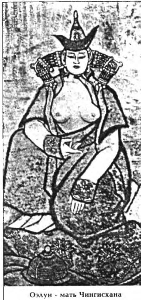
Оэлун - мать Чингисхана