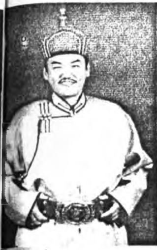
Монгол уласай Президент Нацагийн Багабангу

Монгол ороной болон Россин Федерациин хоорондох гадаадын экономика харилсаа холбоонуудай хүгжэлтэд «Хяагта» гэнэн гарасын онсо ехэ удха шанарыг анхаралдаа абажа, Монголой тала «Алтан-Булаг» гэнэн гарасын пункты ашгалагада тушааха ябадал хурдадхаха талаар хэмжээнүүдые абажа байнхай. Тус барилга эрхилжэ байһан «Зарубежстрой» гэнэн барилгын компани контрактын ёһоор 2002 оной мартын хуушаар хүдэлмэрээ түгсэхэе эһотой юм. Яагаашье һаа, хилэ гаралгын пункты байһан түхээрлэгнүүд нэгэ үдэрөөр урид гү, али тэе хойгошогур гү, заабол баригдажа дүүргэдээ, хүнүүд болон ашаануудые гаргаха шадалын гурба дахин ехэ боложо, гаралгын пункт уласхоорондын зэргэтэй болохо. Хангалгыншые шата хэмжээн баһал дээгүүр болохо эһотой юм бээ.