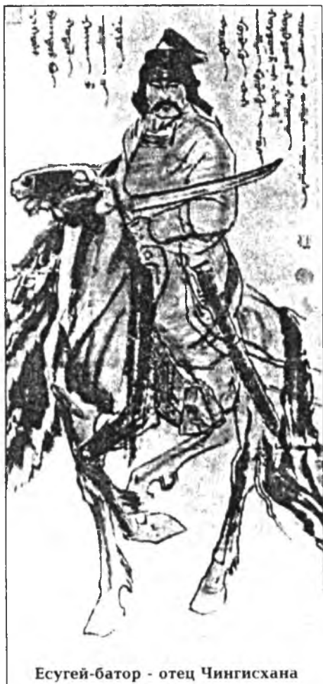
Есугей-батор - отец Чингисхана