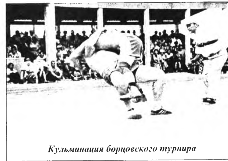
Кульминация борцовского турнира