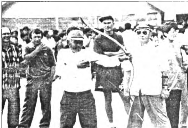
«Поющие» стрелы мэргэнов летят точно в цель