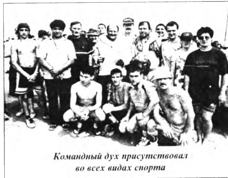
Командный дух присутствовал во всех видах спорта