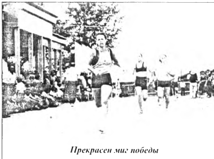
Прекрасен миг победы

ПРАЗДНИК СПОРТА, ФИЗИЧЕСКОЙ КУЛЬТУРЫ И ЗДОРОВОГО ОБРАЗА ЖИЗНИ