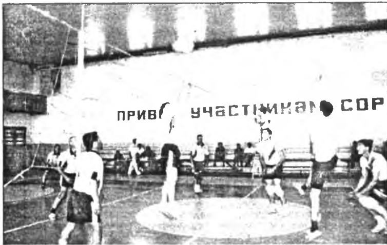
С волейбольным мячом мы на «ты»