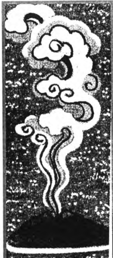
Иимэ ехэ тэсэбэрлэй хадаа буряад зон гурбан зуун жэлэй саанашые, мүнөөшые хамаг ядарал зоболонгы, хүндэ хүшэр байдалье дабан гараал!

Тиигэжэ Бидия Дандарон Балдан Санжин хоёрой гурбан зуун жэлэй саана болоһон аяншалга харуулан роман гүрэн соогуураа олоор тараагдажа, хори буряадуудай гурбан зуун жэлэй саана хэһэн баатаршалга дахин дабтаһан шэнги боложо, олониитые, уншагшадые айхабтараар һонирхуулаа, анхарал татаа бэлэй.