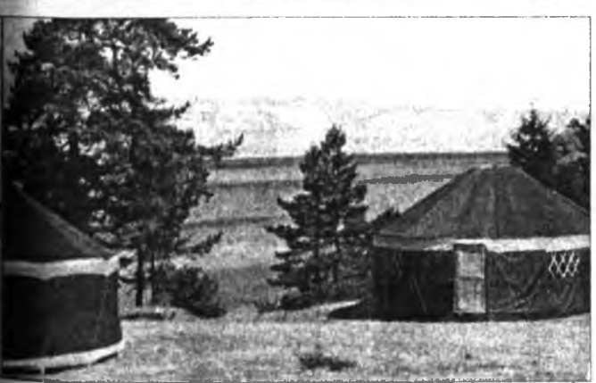
Предъявителю купона скидка 5%

Желаю всем участникам конференции плодотворной работы. Уверен, что в целом деятельность Байкальского экономического форума позволит открыть новые перспективы для экономического, социального и культурного развития Сибири, Забайкалья и Дальнего Востока на основе наукоемких и экологически безопасных производств, развития инфраструктуры, расширения торговли и туризма!