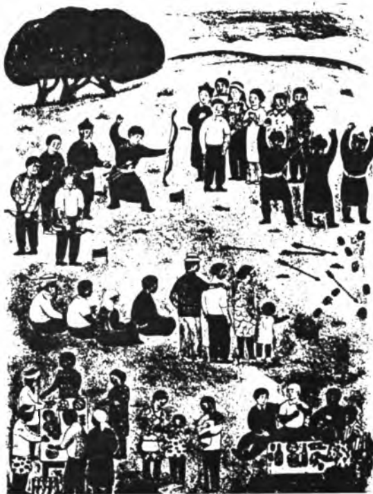
А. Сахаровскаягай зураг.

наһанһаань эхилжэ хэлэндэ оруулхада, үрэтэй байдаг гэжэ мэдэнэбди. Эдэ бүгэдэ шухала хэргые илангаяа Улаан-Үдэдэ эмхидхэбэл, һайн байха бэлэй. Эмхидхэмээр газар - үхибүүдэй сээрлинг (детсад) гүб даа. Сээрлингтэ буряад хэлэндэ хургаха зорилготой пособи, методико гэжэ бин юм гү, али багшанарын шадаха зэргээрээ хүдэлдэг юм гү? Үгы юм хаань, дары бин болгоел. Инмэ уялгатай методико тон хэрэгтэй, тэрэнэй ёһоор эрилтэ табихал болонобди. Тиигээгүйдэ хүсэд хуралсал болохогүй. Бодоол үзэт, городой нилээдгүй олон гэртэхин өөһэдөө буряадаар мэдэхгүй, гэргээ ород хэлэн дээрэ харилсадаг байна. Тиимэ халань детсадай хүсөөр буряад хэлэндэ багашуулые оруулхань шухала, эдэ бүгэдые нэн түрүүн түрэлхид дэмжэхэ ёһотой.