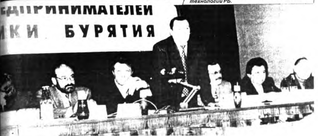
XVII СЕССИЯ НАРОДНОГО ХУРАЛА РБ