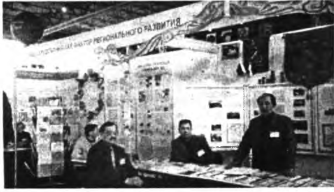
Экспозиции выставки лицея-интерната №1

Этой победе предшествовала кропотливая работа педагогов и учащихся лицея. В прошлом году интернат вошел в число ста лучших школ Российской Федерации! На выставке лицей выступал в разделах «Образование в регионах России».