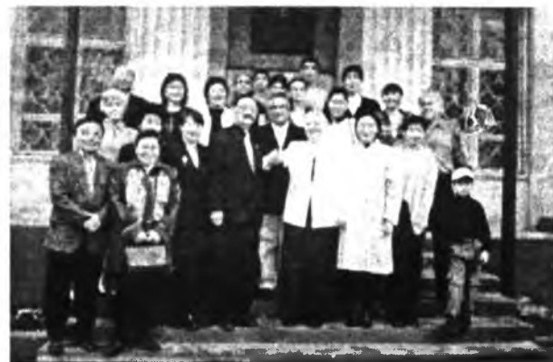
В многонациональной армянской школе г. Москвы, где обучаются дети буряты

образования. Единородное образовательное пространство (ассоциированные школы ЮНЕСКО)». По последнему пункту интернат принял участие в третьей Всемирной конференции ПАШ, прошедшей в рамках выставки. В сферу внимания школы вошли «круглые столы» по темам «Всемирно-культурное и природно-наследие в Интернете», «Воспитание и образование политической школе».