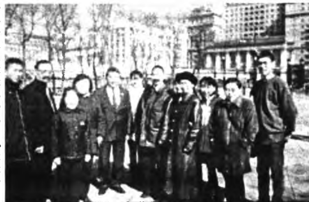
В Александровском саду

Перспективы развития «Воспитание учащейся молодежи - один из приоритетов образовательной политики (система дополнительного образования; экспозиция музыкальных, художественных и спортивных школ)», «Культура мира, ее формирование средствами