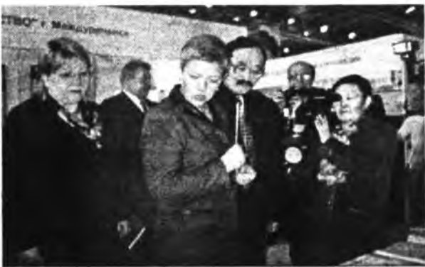
Зам. Министра образования РФ Е.Е. Чепурных у стенда выставки

Перечислять все регалии и заслуги лицея было бы неблагодарным занятием. Слишком их много, и всегда они на слуху у всей республики. Это блестящие успехи в учебе: многочисленные призовые места на конкурсах и олимпиадах различного уровня и профиля, высокий процент поступления в высшие учебные заведения. Одной из последних наград лицея-интерната можно назвать титул лауреата на пятой московской международной выставке «Школа - 2001», проходившей в апреле в культурно-выставочном центре «Сокольники».