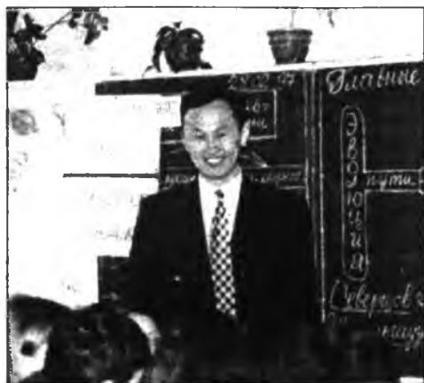
ехэтэй, эдэбхи үүсхэлтэй, оролдосотой бэрхэ хүтэлбэрилэгшэ, ёһотой багша байһанаа харуулаа.