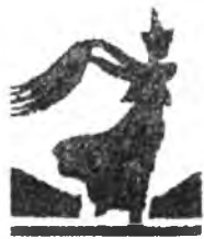
(Үргэлжлэл. Эхнийн октябриин 11-нэй дугаарта).

НААДАХА НИОУРНУУД БОРСОЙ НОЁН - отогой ахмад, Дүүдэй-Мэргэнэй эсэгэ, БАМБАА ЭЖЫ - Дүүдэй-Мэргэнэй эхэ.