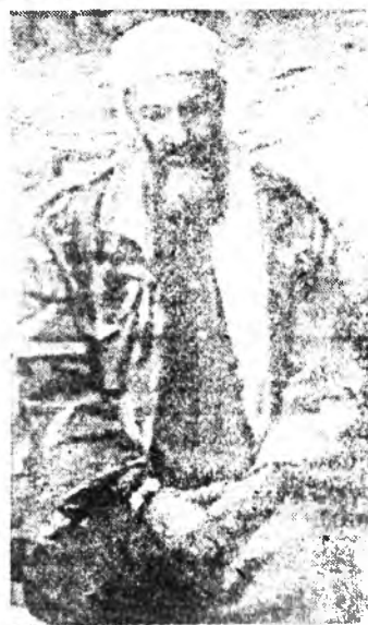
Усама бен Ладен во время телевизионного выступления, переданного 7 октября. Он вознес хвалу Аллаху за теракты в США

Под усиленной охраной улицы и "подземка", железные дороги и автомагистрали. Впервые в истории США вводится пост на уровне члена кабинета министров - руководителя по обеспечению внутренней безопасности.