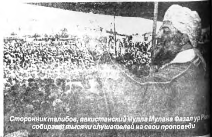
Сторонник талибов, пакистанский Мулла Мулана Фазал ур Рахман собирает тысячи слушателей на свои проповеди