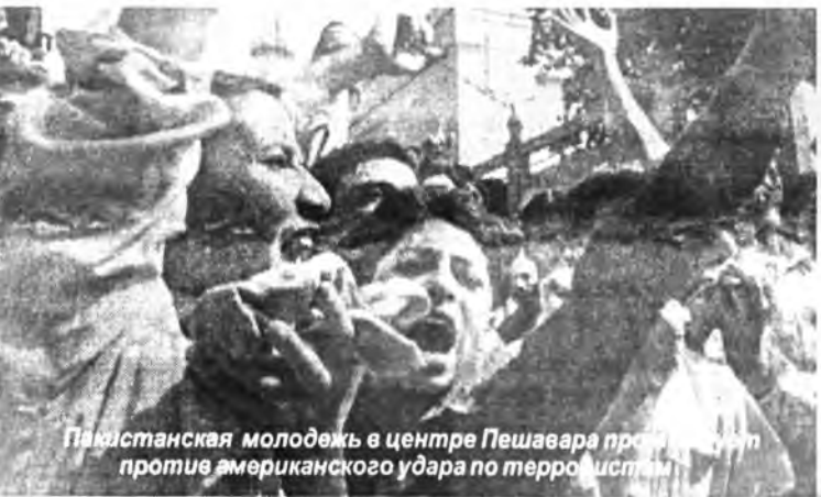
Пакистанская молодежь в центре Пешавара протестует против американского удара по террористам

Джордж Буш и его помощники неоднократно предупреждали арабские страны, что первый удар - это начало в длительной войне с террористами. Кто станет победителем в этой войне - на этот вопрос никто не может быть ни у кого не вызывает сомнения. Но какова будет цена победы? Вот вопрос, который с тревогой задают во всем мире, прежде всего в самой Америке.