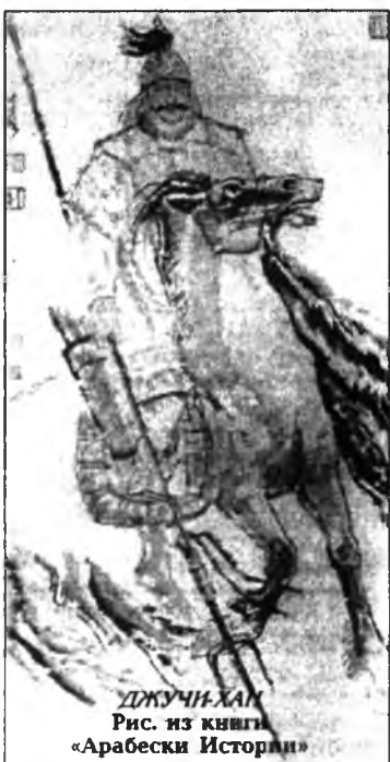
ДЖУЧИ-ХАН Рис. из книги «Арабески Истории»

Вечером Захарий и Судуй, поужинав, легли спать у тлеющего аргага. Полная луна, похожая на блюдо, чеканенное из желтой меди, висела низко над холмами. По всему берегу светлячками мерцали огоньки, слышался приглушенный