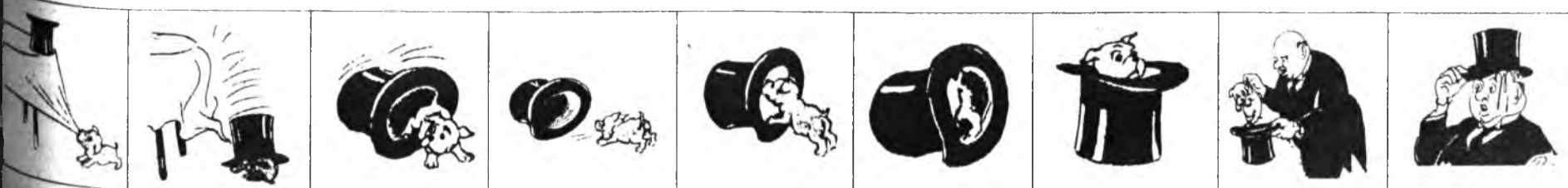
«Монгол зураг» номһоо.