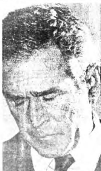
Джорджу Бушу предстоит принять еще много трудных решений в долгой кампании, начатой бомбардировками в Афганистане

Итак, американский военный курок спущен, и сейчас можно только гадать, что за лавина, разбуженная этим выстрелом, обрушится на мир и что она погребет под собой, а что удержится на поверхности. Безусловно, основной задачей первого этапа антитеррористической операции является уничтожение военной инфраструктуры "Талибана". "Мы победим в этом конфликте", - заверил президент Д. Буш, подчеркнув, что США его не хотели. Как он сказал, Соединенные Штаты две недели предупреждали афганских талибов, закрыть базы террористов, выдать Усаму бен Ладена и других лидеров группировки "Аль-Каида", освободить иностранных заложников, включая американских граждан. "Ни одно из этих требований не было выполнено", - констатировал Буш. "Перед лицом сегодняшней новой угрозы, - сказал он, - нет другого способа сохранить мир, кроме как преследовать тех, кто ему угрожает".