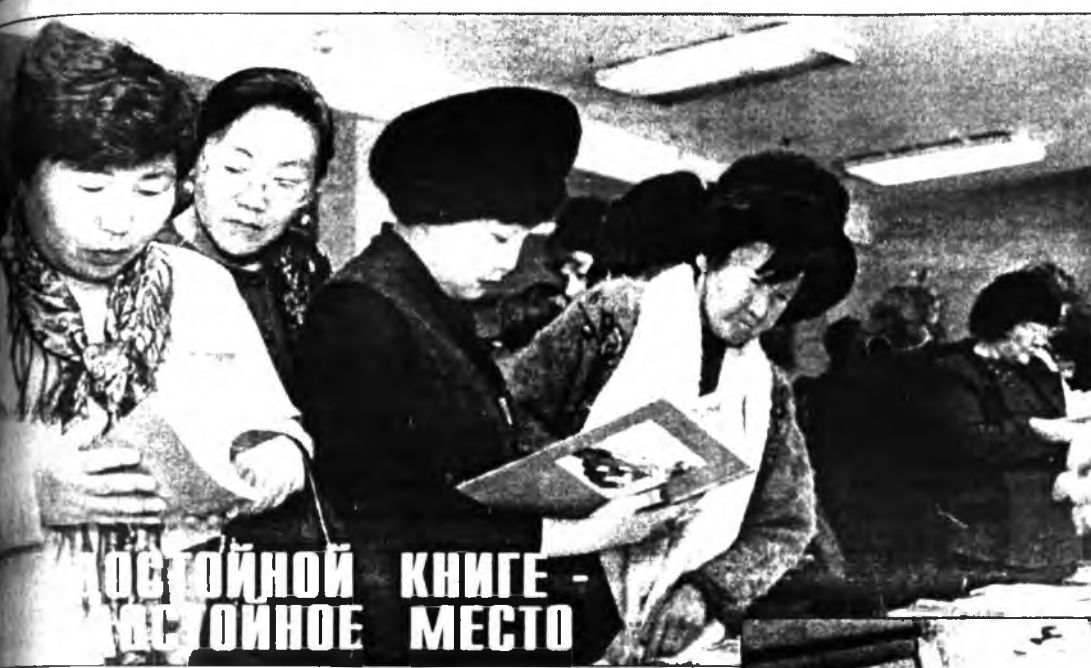
В ОВОЙНОЙ КНИГЕ - ОДИНОЕ МЕСТО