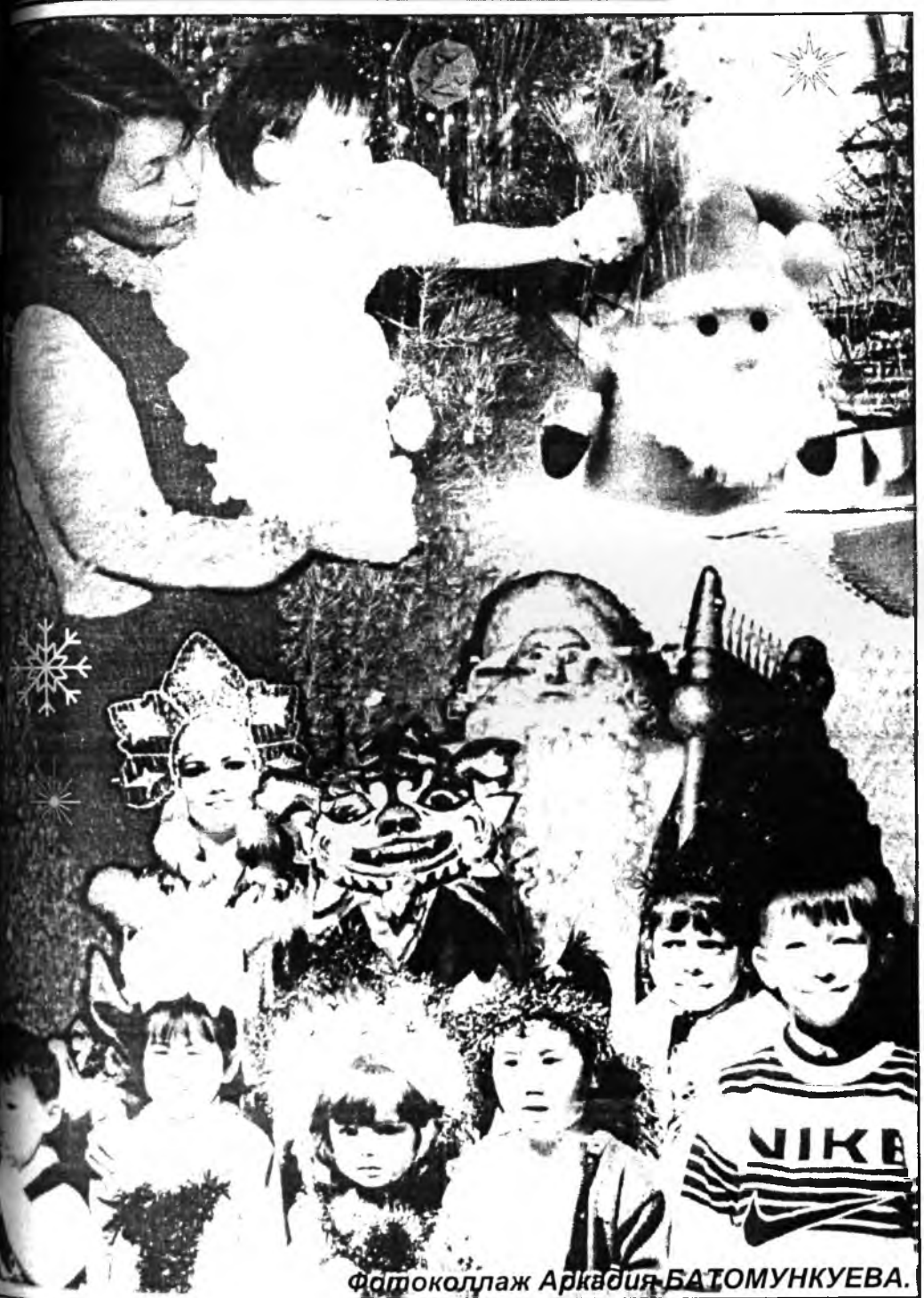
Фотоколлаж Аркадия БАТОМУНКУЕВА.