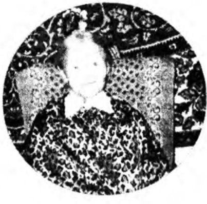
Эрхивэ яаралгүйгөөр эмэрюулэнт. Хадам эжы үрээл табина Хүн түрэлтэйнэй найн хуухын түлөө, Хүбүүд, бэрэзд, хурьгэд, басагад,

Хүүгэдэйнгээ харгы замые арюудхажа, Аяга сайнгаа дээжэһээ Алтан дэлхэйнгээ бурхагта үргэжэ, Сэгдхэлэйнгээ найхан үрээлье хэлэжэ, Сээжынгээ угхатай хөөрөөе дэлгээнэт. Найман хүүгэдэй эжы - Найдамтай манай түшэгнай, Арза хорзынгоо дээжээр Алтан дэлхэйнгээ сүршэн, Ухаандаа мэгзэм маани уншажа, Үглөөдэргэйнгөө харгы замуудые нээжэ, Энэ дэлхэйнгээ, нараяа тойруулангал