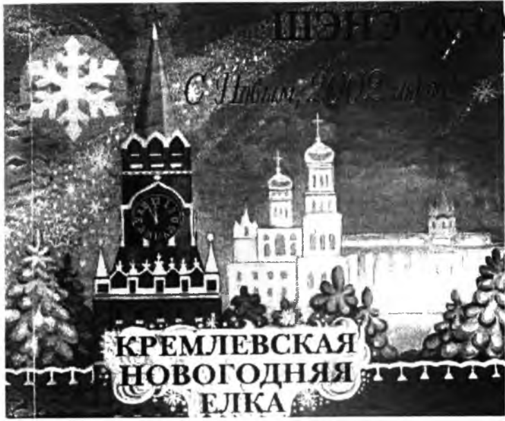
КРЕМЛЕВСКАЯ НОВОГОДНЯЯ ЕЛКА