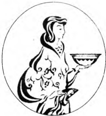
Морин эрдэнийн хэшэгүүд