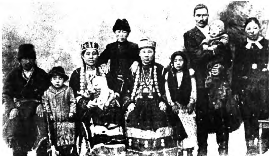
Откликов на родословную, опубликованную в предыдущих номерах популярной газеты «Дүхэрэг», оказалось неожиданно много. Древо заинтересовало не только бурят, но и русских, представителей других национальностей. Хотя сбор материалов шёл десять лет, пробелов в родословной немало, они вызывают вопросы, сомнения и у меня, и у читателей.

Справедливы претензии читателей в том, что необходим ряд уточнений и пояснений к расщепровке нумерации. К сожалению,