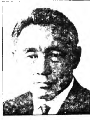
улад зоной сээжэдэ улаалзангаар сэсгээт. Буураал толгойгоо дохин бариналби шүлэгөө танда - табигдаагүй хүшөөгэйтнай табсанинь боложо үгүүжэн...