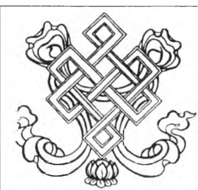
Беконсчнй узел (санскр.: crivatsa; тиб.: dral be'u) — геометрическая фигура, символизирующая благополучие, единство всех вещей и переменчивый характер времени.

Дагдор - долговечный балин, изготавливаемый из золота, серебра, меди и передаваемый из поколения в поколение, ставится на алтаре перед бурханом. Жундор - это регулярный балин, периодически меняется в конце каждого года. Материалами для его изготовления служат ячменная мука, топленое масло, сахар, мед. Его также оборачивают драгоценным самоцветом и покрывают тонкими украшениями из козьего или ячьего жира в виде цветка лотоса. Ритуал освящения балина в дацане одновременно очищает каждый очаг в семье. Поэтому желательным было бы приобрести освященный балин и преподнести их у себя дома. До начала этих хуралов мирянин должен навести чистоту и порядок у себя дома и на алтаре. Должны быть развернуты все бурханы и преподнесены им различные кушанья и балины. На 28-й лунный день в дацанах проходят молебны благодарения идама Ямандаги и сакьюсанам: Гомбо Гонгор, Шагдар, Шалши, Сэцдэма, Намсарай и др. Церемония одновременного поклонения всем сакьюсанам проводится один раз в год. В этот день желательным отблагодарить своих хранителей за защиту и покровительство в прошедшем году, преподнести на хурале подношения в виде балина, сэргэма и далга. При подношении сэргэма (путем заклинания) или очищая сэргэм от скверны, ламы трансформируют сэргэм в божественный напиток - «амброзия». Преподносят его божествам, возлагая должное за их покровительство в прошедшем году и за покровительство в наступающем году.