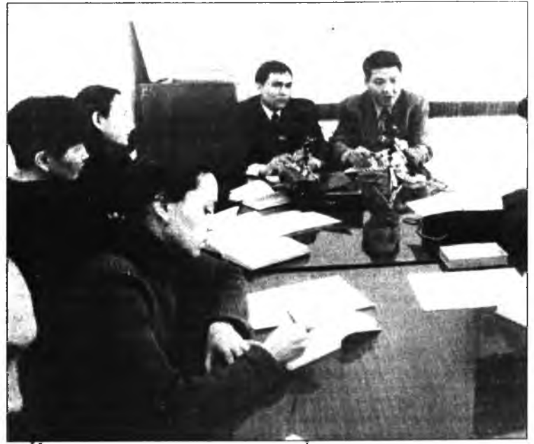
На снимке: во время пресс-конференции