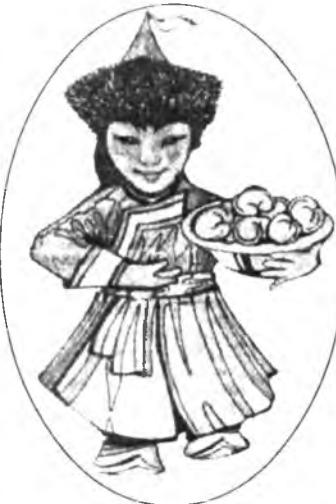
«Уужал бай, Ургажал бай, Бэшэжэл бай, Батожабай»

Би садхаланби, эдээлээ эрээ һэм. Та өөрөөл эдигты, танда гэжэ асараа ха юмбиб. - Ородуудыг бү һажаалда. Би садхаланби, мүнөө һая эдээлээ һэм гэлдээг тэдэнэр, - гэжэ, Батожабай архи өөртөө аягалаад, - Буузаш энэһэй, - гэн аягатай архияа улаан болоһонон хамарайнгаа үзүүртэ абаашаад, ухаа зан үргэлжэлүүлэбэ. - Еһоор даруулга гээшэ. Архинша хүн