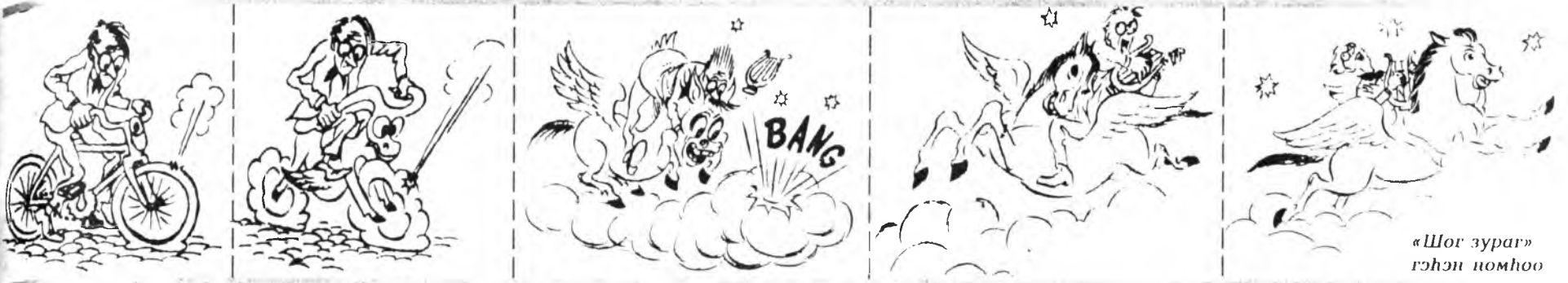
«Шог зураг» гэнэн номноо