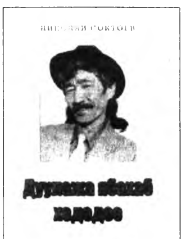
Дуулажа ябахад ходоодоо

театрай бэшэ, мүн баһа филармонийн артистууд гүйсэдхэдэг болоо һэн. Буряад театрай 60 жэлэй ойдо зориулагданаан «Буряад театр» гэжэ дуулинь театрай гимн болонхой.